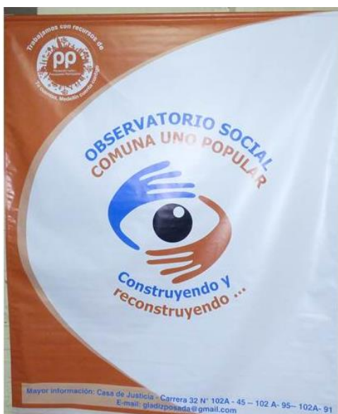
Observatorio social